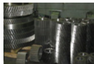
Венцы зубчатых колес, шестерни ведущие