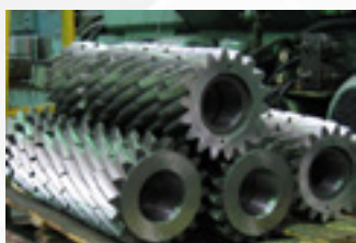
Шестерни ведущие тяговых передач