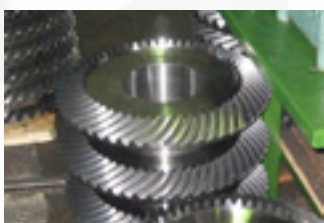
Колеса зубчатые универсальной колесной пары