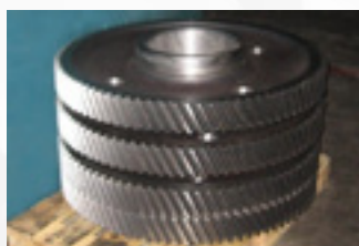
Колеса зубчатые тяговых передач