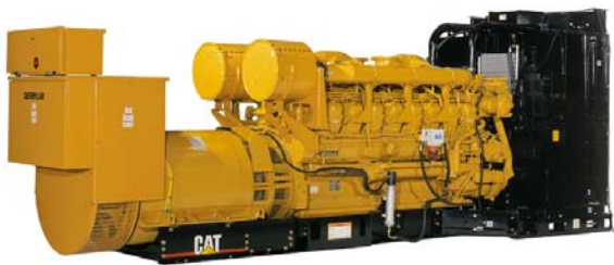
Генераторная установка показана с оборудованием, устанавливаемым по специальному заказу