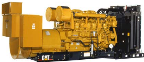
Генераторная установка показана с оборудованием, устанавливаемым по специальному заказу